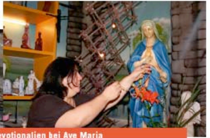
Devotionalien bei Ave Maria