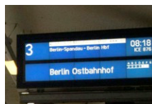
Deutsche Bahn Neuer Notfahrplan mit Direktverbindung Berlin- Wolfsburg